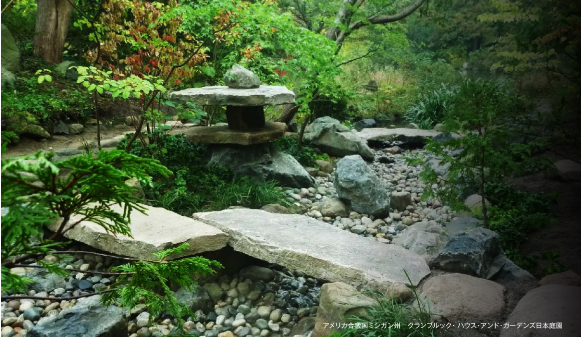
アメリカ合衆国ミシガン州 クランブルック・ハウス・アンド・ガーデンズ日本庭園