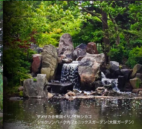
アメリカ合衆国イリノイ州シカゴ ジャクソンパーク内フェニックスガーデン(大阪ガーデン)

〔内容〕 「日本庭園の国際的な価値を再確認し、令和時代の日本庭園を考える」をテーマとしたシンポジウムを開催いたします。海外日本庭園再生プロジェクトの一環として、5年間の成果を振り返りつつ、日本庭園の可能性や情報発信、海外の動向、庭園技術の展開などを考えます。