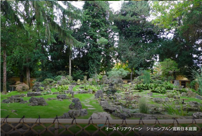
オーストリアウィーン シェーンブルン宮殿日本庭園